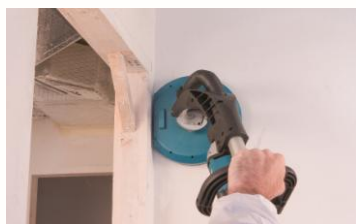
Ponçage en angle