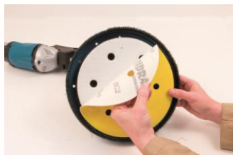
Plateau auto agrippant pour disques diamètre 225 mm