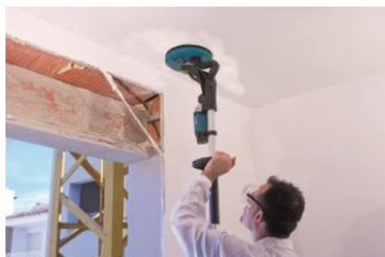
Ponçage des plafonds